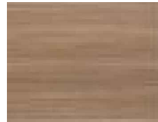
Padrão NOCE AMÊNDOA

TRIBUNAL DE CONTAS DO ESTADO DE SÃO PAULO