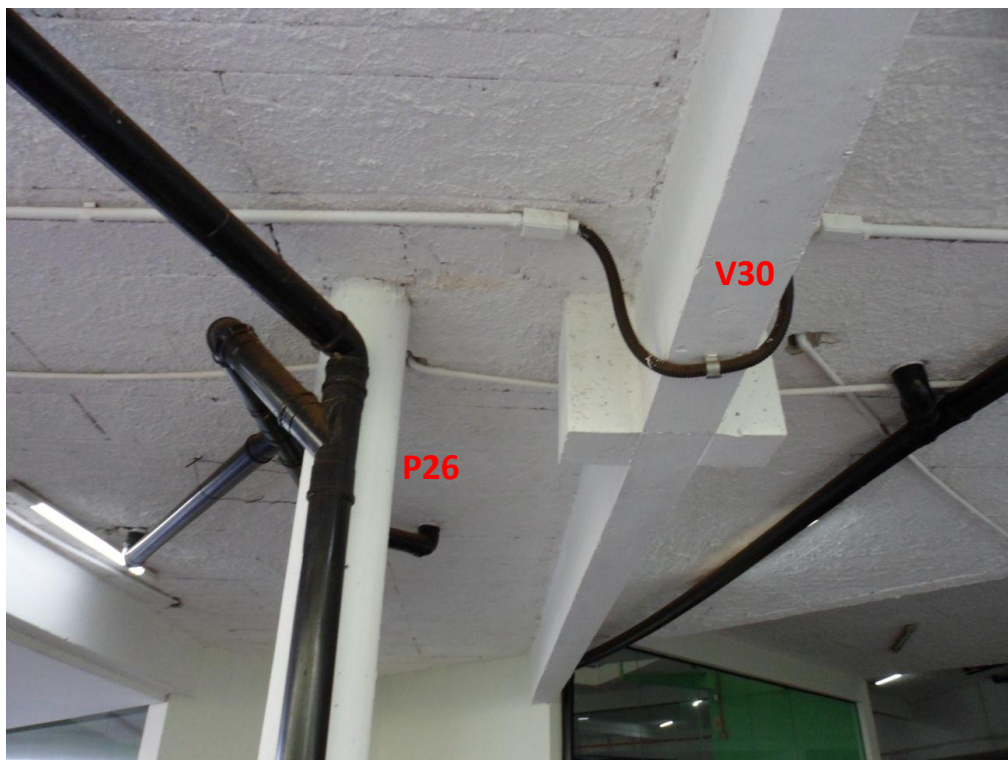
Ilustração 33 – Detalhe das peças estruturais sob o terraço B