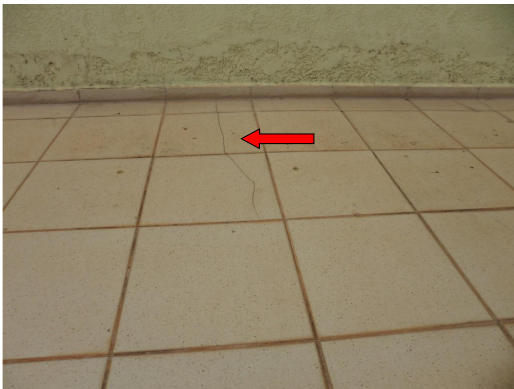
Ilustração 25 – Trinca no revestimento do piso do terraço D