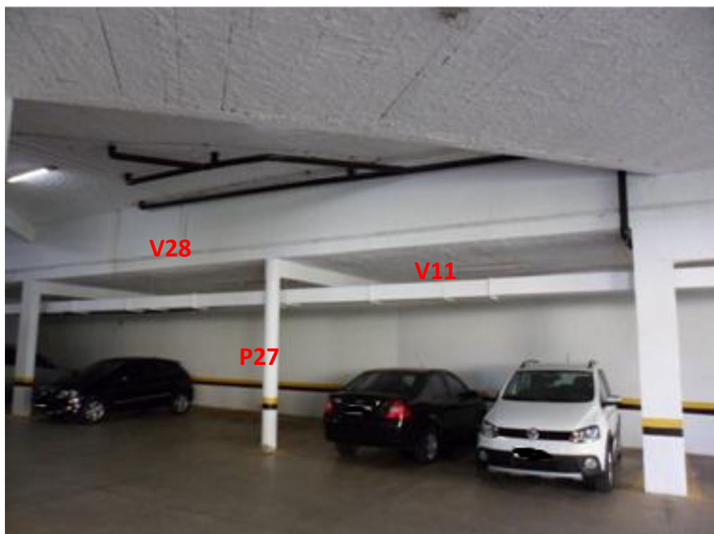
Ilustração 30 – Identificação das vigas sob o terraço C