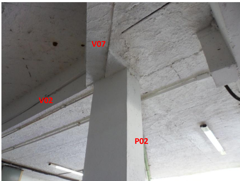
Ilustração 34 – Peças estruturais sob o terraço B