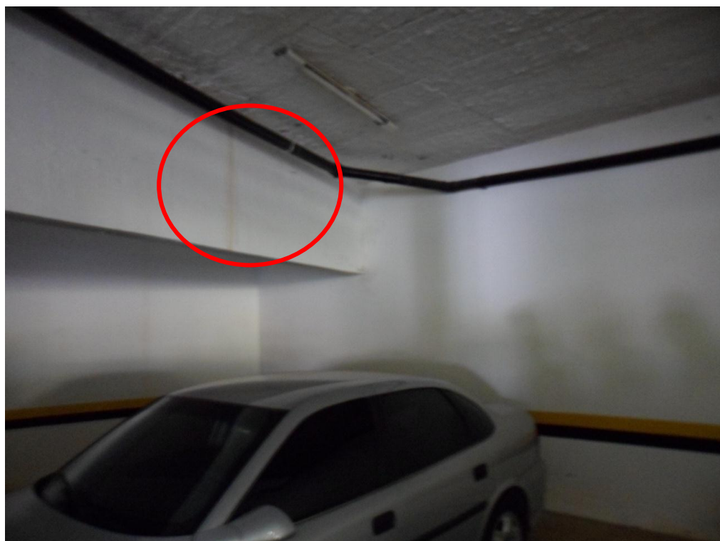
Ilustração 36 – Evidência de infiltrações