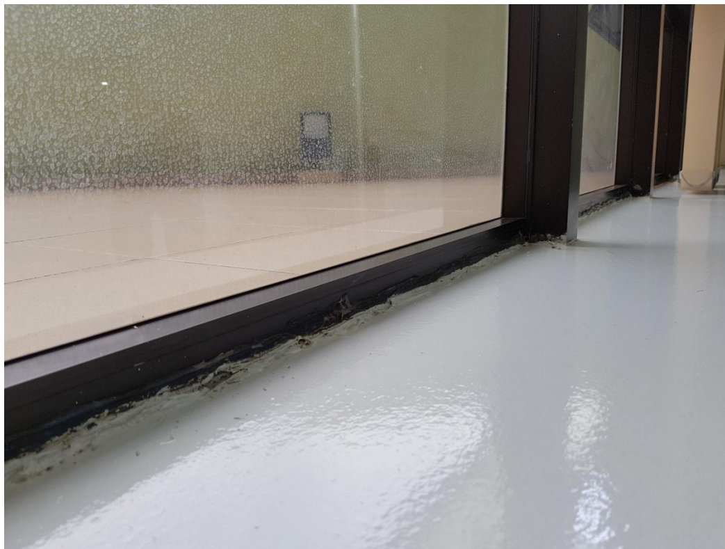
Ilustração 40 - Caixilhos