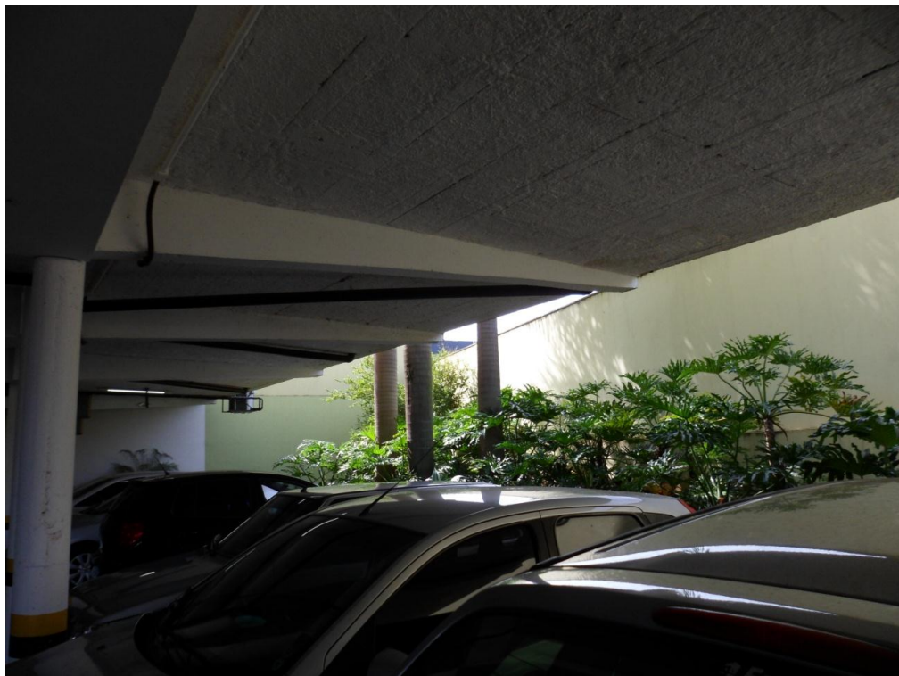
Ilustração 35 – Laje do terraço B em balanço