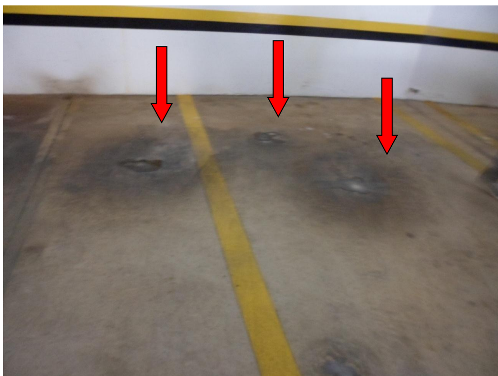
Ilustração 38 – Marcas no piso da garagem, sob o terraço C, devido a infiltrações