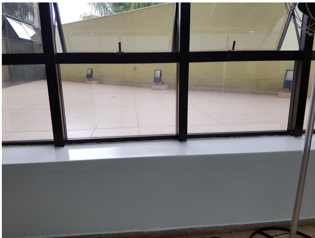
Ilustração 39 – Caixilhos