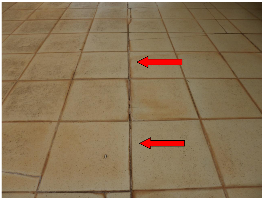
Ilustração 23 – Movimentação do revestimento do piso no terraço C