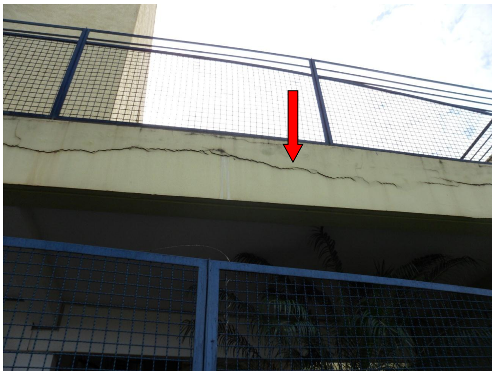
Ilustração 27 – Trincas