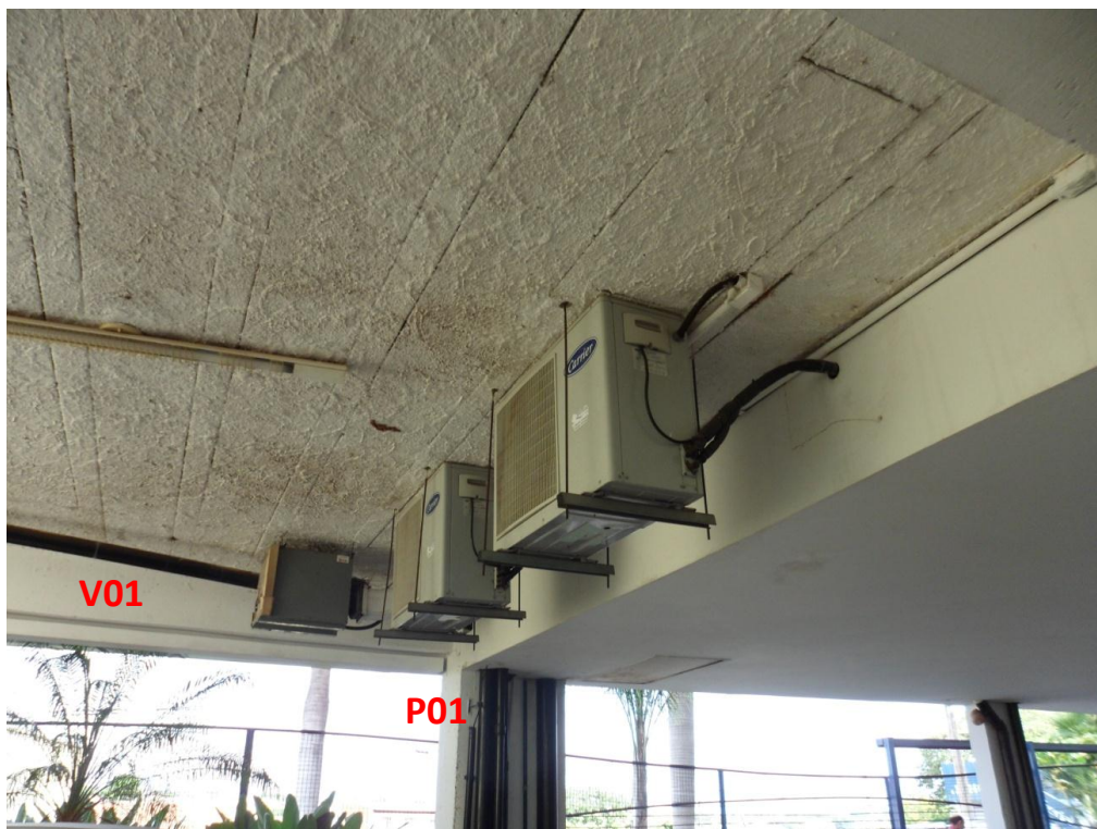
Ilustração 31 – Identificação de peças estruturais sob os terraços A e B