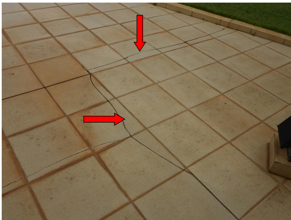
Ilustração 24 – Trinca no revestimento do piso do terraço C