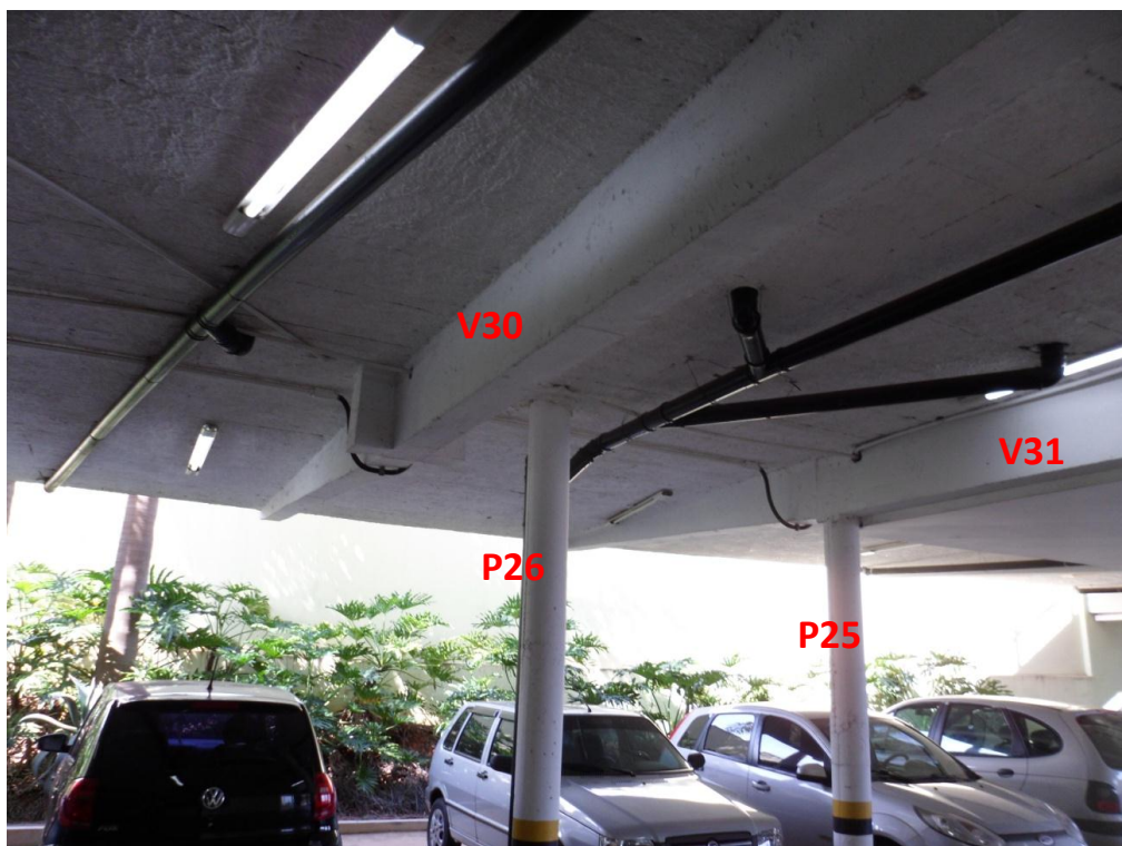
Ilustração 32 – Peças estruturais sob o terraço B