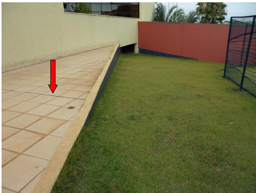
Ilustração 26 – Movimentação do revestimento do piso no terraço D