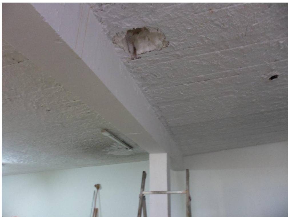
Ilustração 28 – Laje pré-fabricada com enchimento em EPS