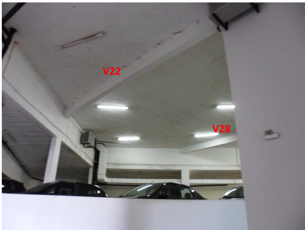
Ilustração 29 – Vigas sob os terraços C e D