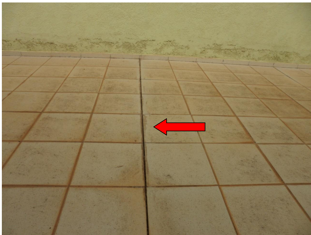
Ilustração 21 – Movimentação do revestimento do piso no terraço C