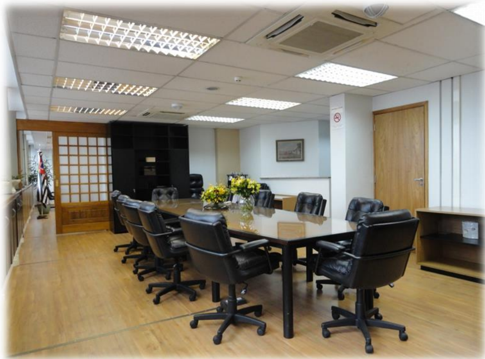
Sala de Reuniões