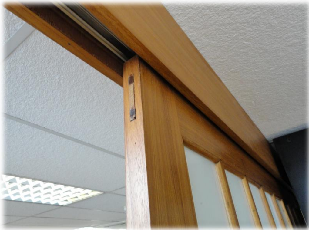
Detalhes da Porta de Correr