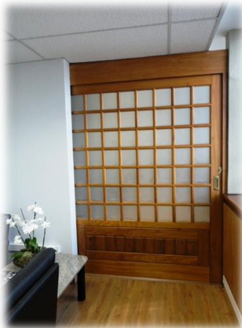
Porta de Correr