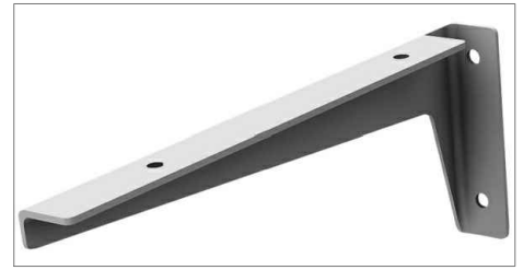
Sugestão de modelo da mão francesa