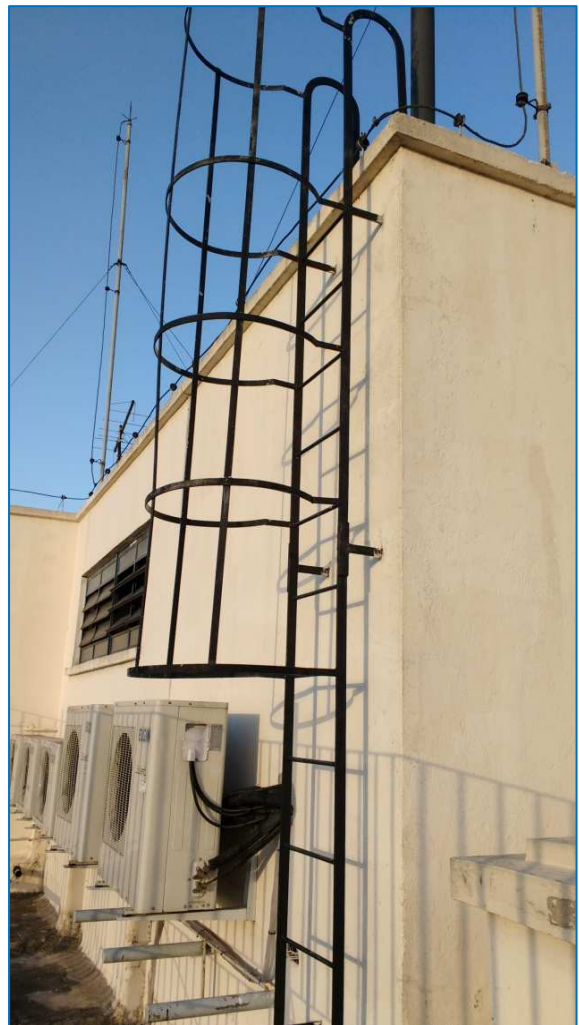
Imagem 2 - Escada marinheiro