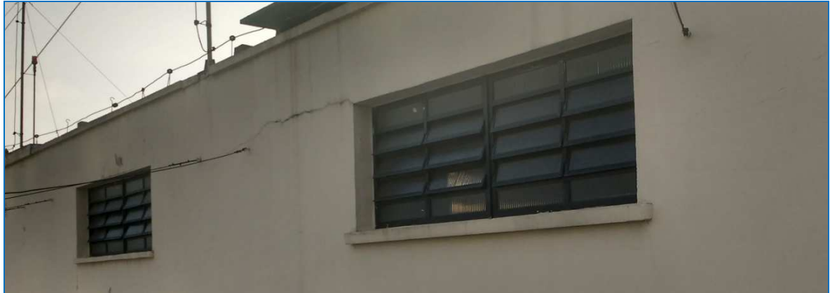
Imagem 5 - Vitrôs da casa de máquinas