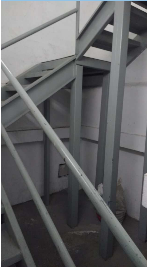
Imagem 3 - Escada de acesso à cobertura