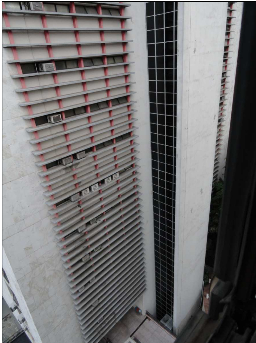
Imagem 1 - Fachada posterior