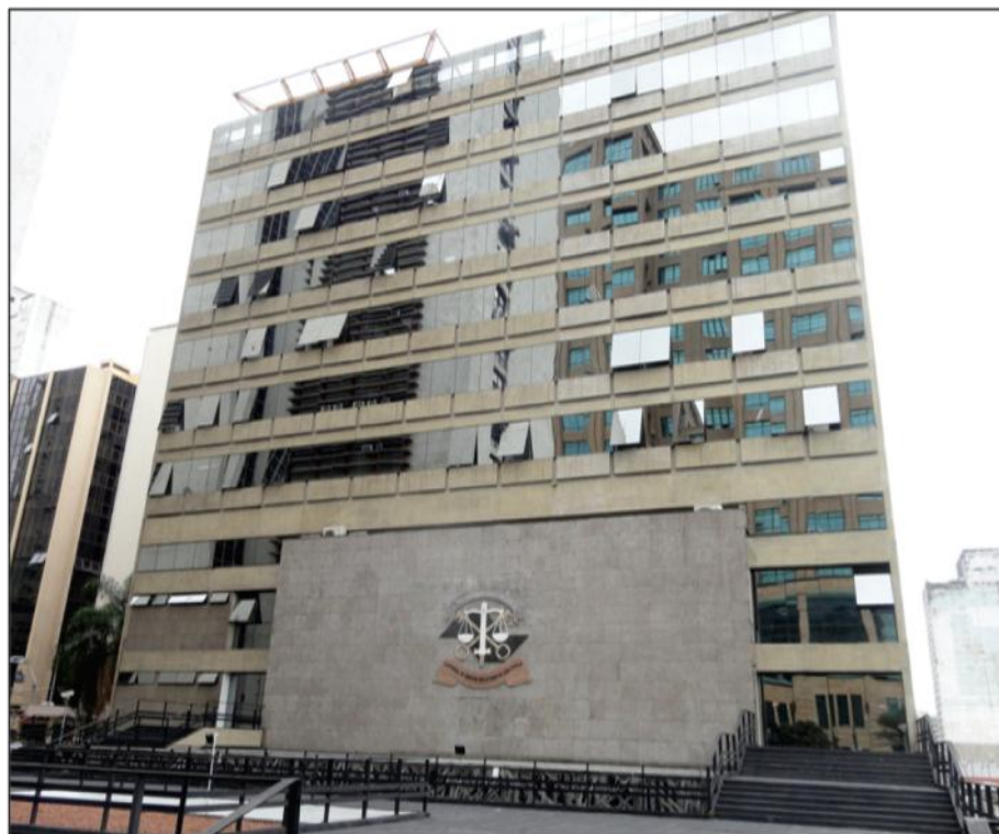
Figura 2 - Fachada frontal sul – voltada para a Av. Rangel Pestana