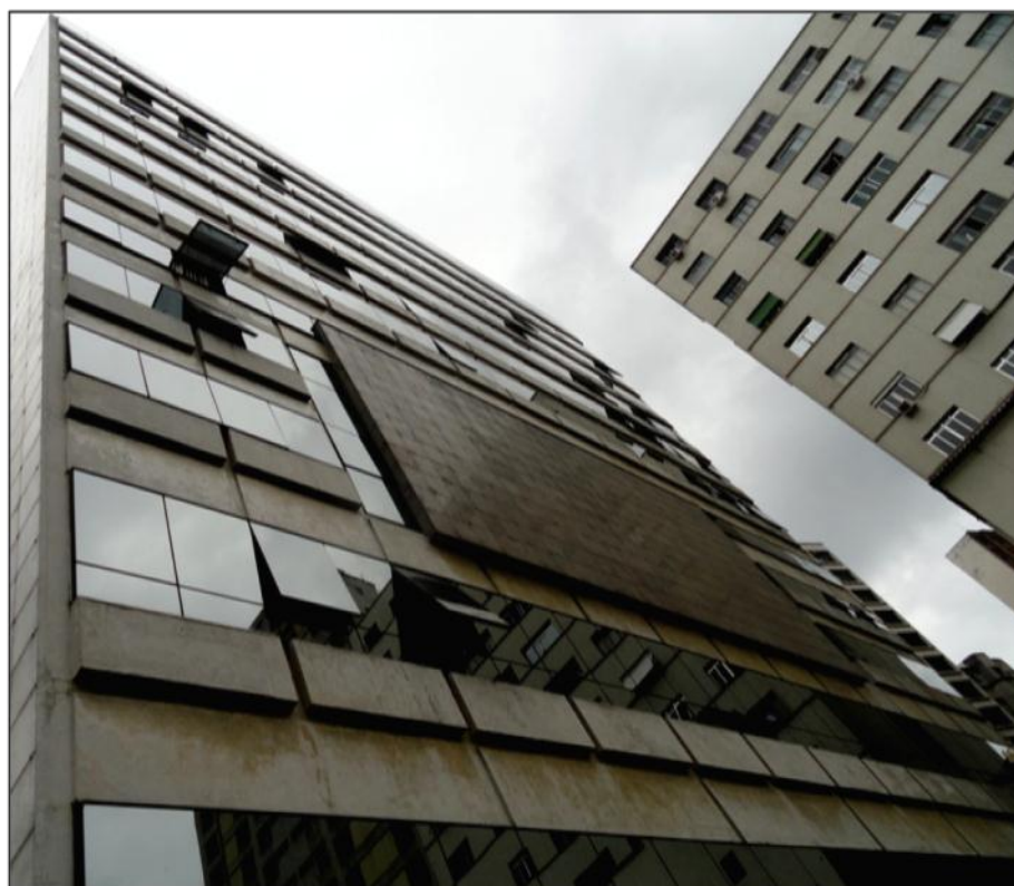
Figura 3 - Fachada posterior norte