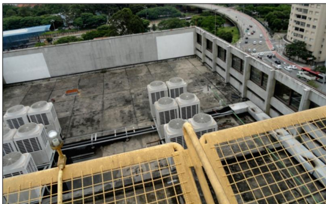
Figura 7 – Cobertura