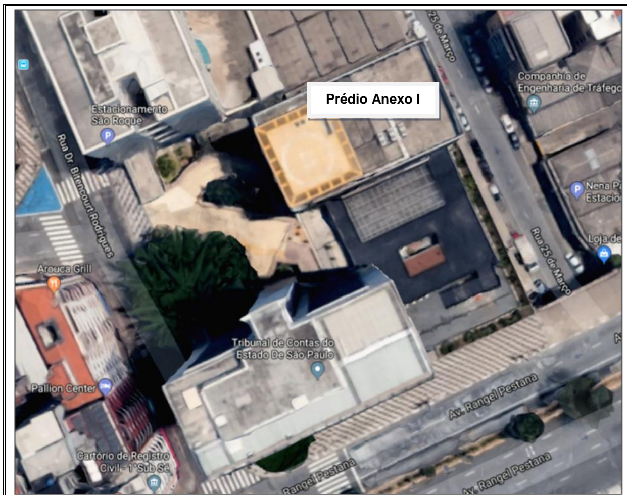
Figura 1 – Localização da edificação

Prédio possui 15 pavimentos compreendidos entre casa de máquinas (cobertura), andares tipos (escritórios), auditório, mezanino, andar intermediário, térreo e mais 4 subsolos. O andar tipo possui dimensão de 17 x 31m e subsolos com dimensões maiores e variáveis, compreendendo nesses pavimentos garagens, almoxarifado e gráfica.