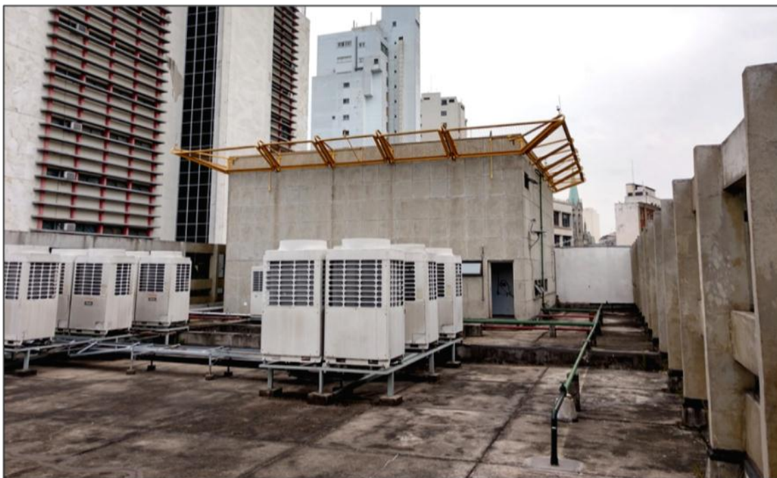
Figura 6 - Cobertura