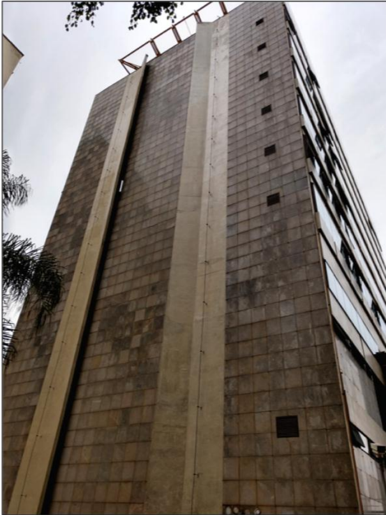
Figura 4 - Fachada lateral oeste – voltada para R. Dr. Bittencourt Rodrigues