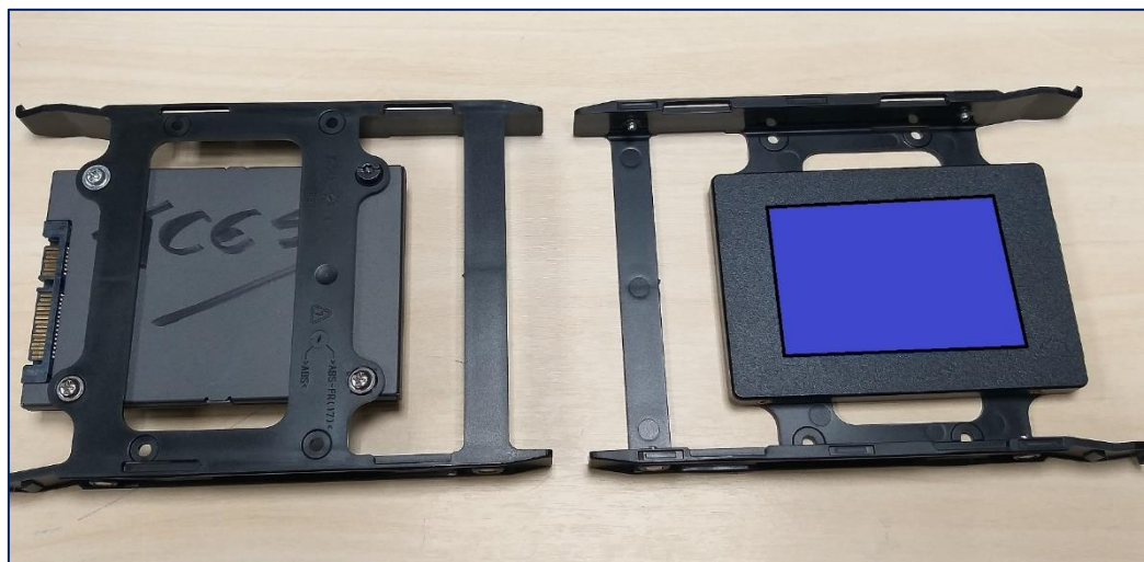
Figura 1: Suporte para HD/SSD (vista da parte superior e inferior)