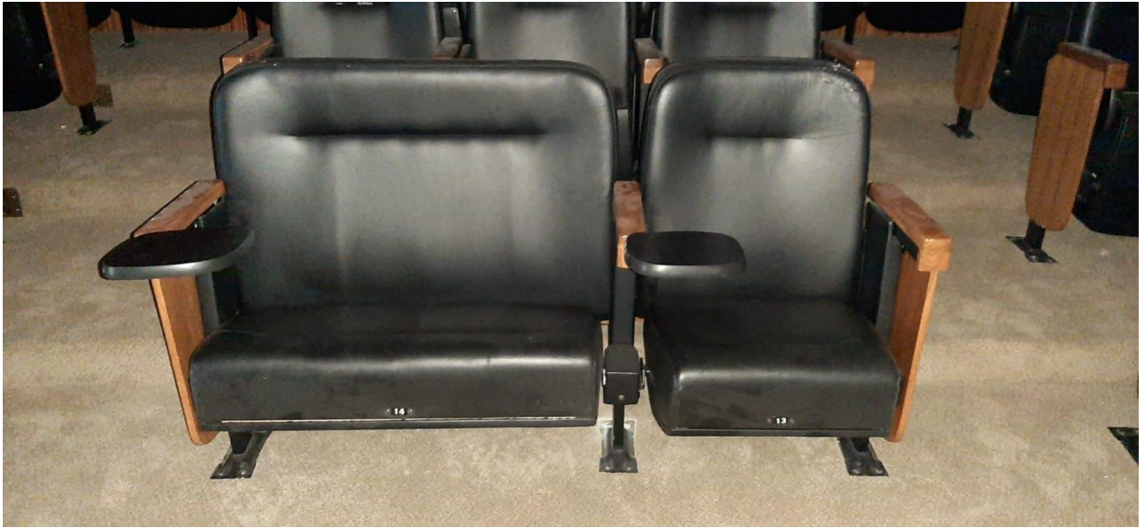
Imagem 1 – Poltronas