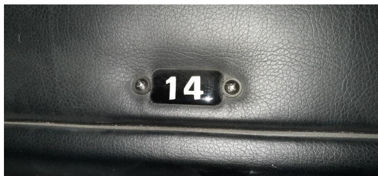
Imagem 3 – Identificador da poltrona