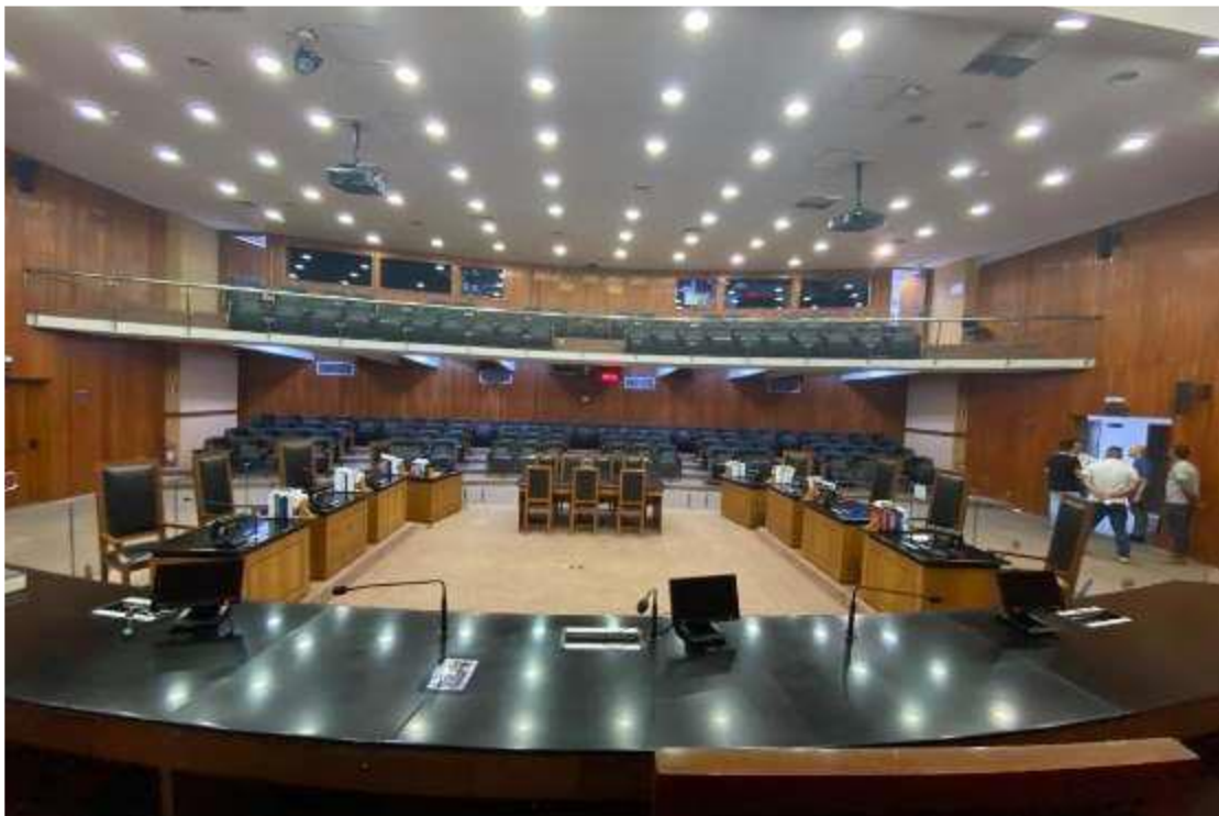
Imagem 2 – Local