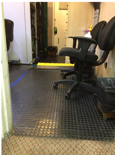
Figura 4 – Piso emborrachado

2.2 Remoção parcial do piso de borracha da sala técnica, exceto áreas onde não serão instalados o piso elevado (Figura 4). O piso emborrachado deverá ser removido cuidadosamente, incluindo eventuais resíduos de cola. Incluso todos os materiais necessários para a perfeita funcionalidade e acabamento do serviço, ferramentas e mão de obra.