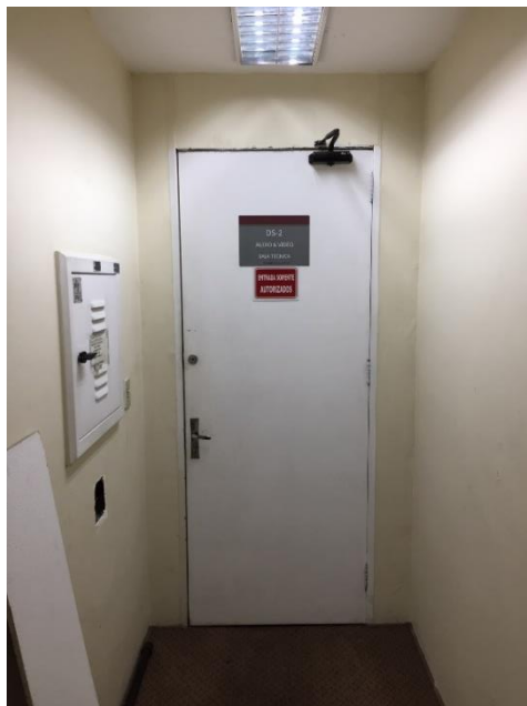
Figura 3 – Porta a remover