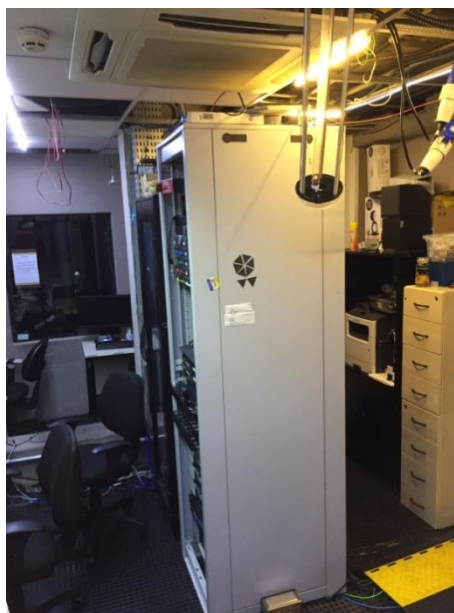
Figura 2 – Mobiliários