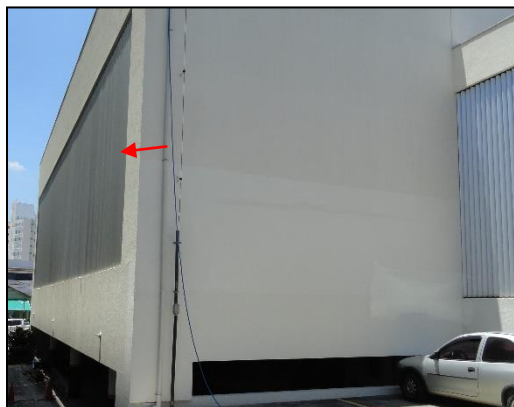
Imagem 2 – Fachada antes do evento