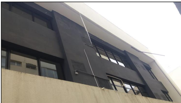
Imagem 1 – Local da instalação do brise

A presente contratação tem por objeto recomposição do brise metálico prejudicado pela ação de ventos fortes.