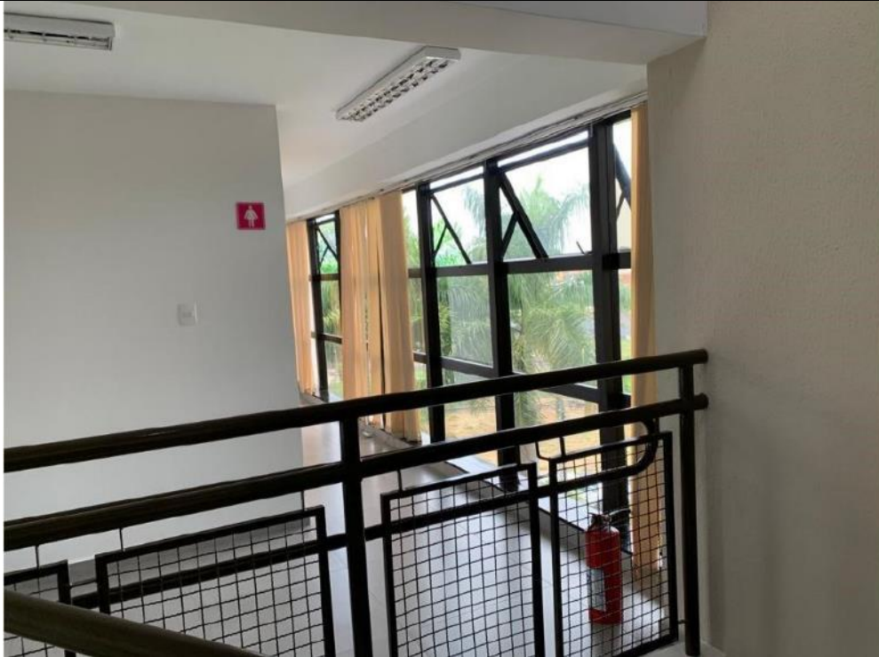
Figura 23: Sanitário feminino