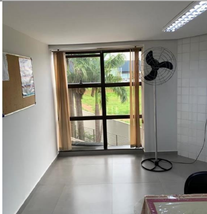
Figura 16: Copa – Lado esquerdo