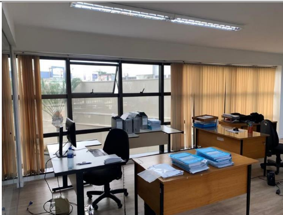
Figura 11: Seção 11.1 – Lado esquerdo