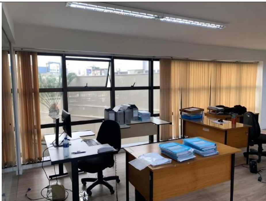
Figura 18: Seção 11.2 – Lado esquerdo