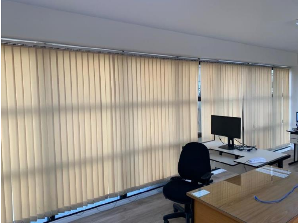
Figura 19: Seção 11.3 – Lado direito