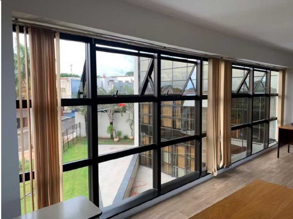
Figura 21: Seção 11.4 – Lado direito