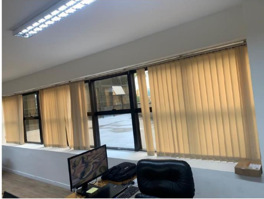
Figura 5: Protocolo – Lado esquerdo