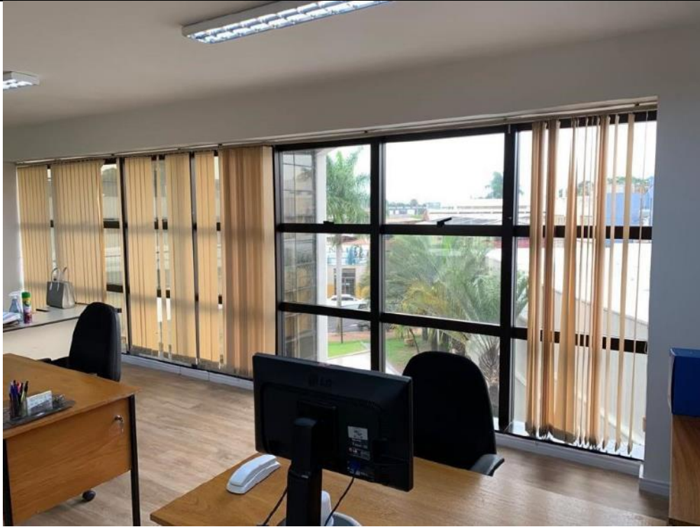
Figura 25: Seção 11.5 – Lado direito