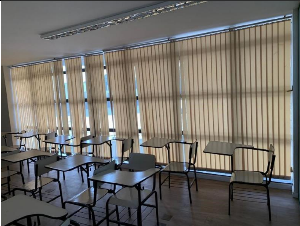
Figura 27: Auditório – Lado direito