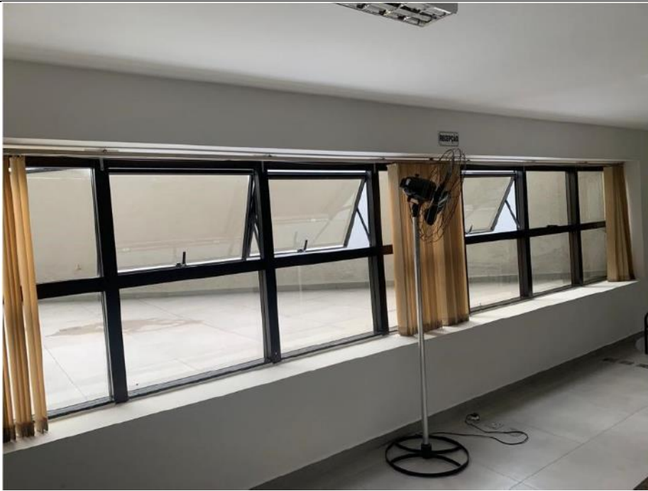
Figura 1: Recepção