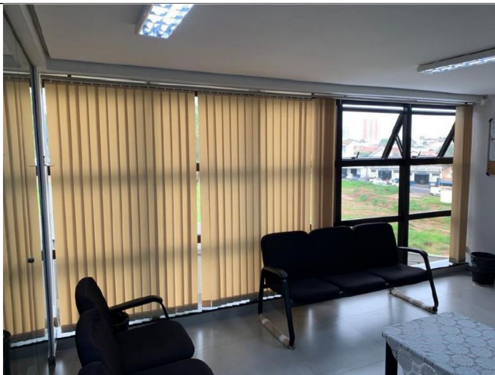
Figura 12: Sala de espera