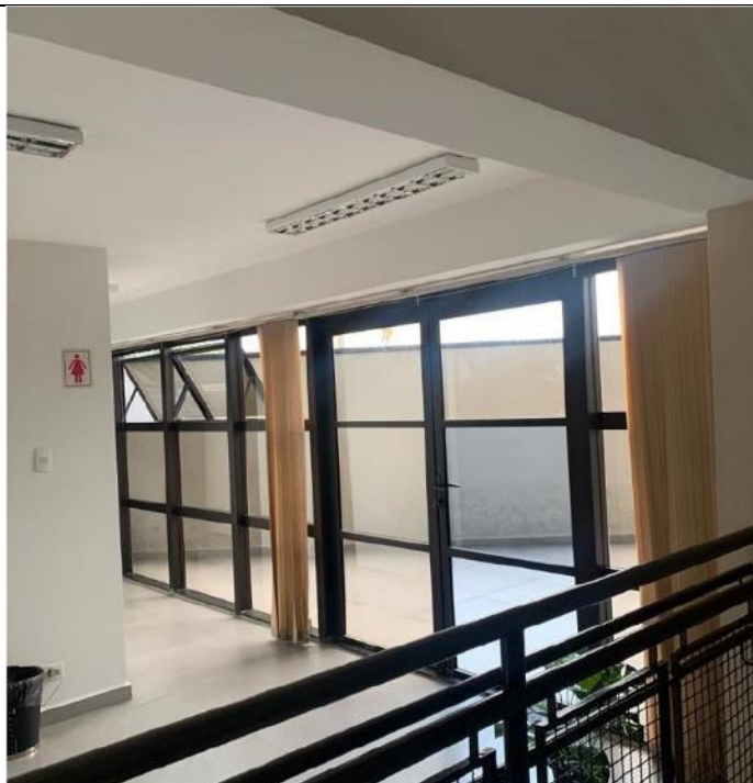
Figura 2: Sanitário feminino