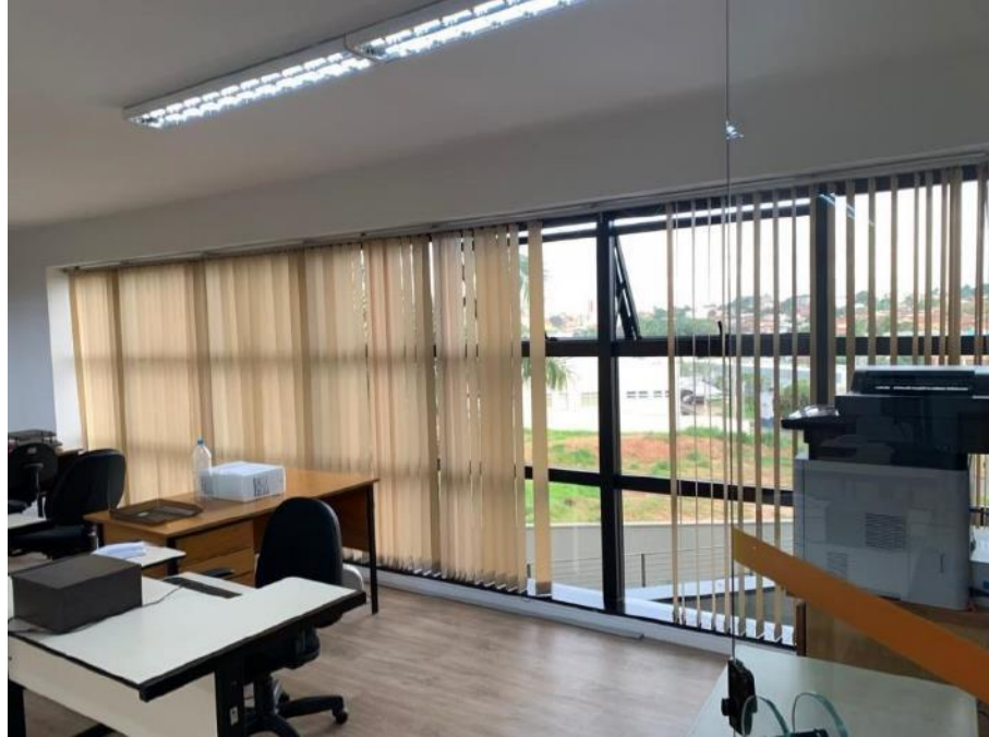
Figura 17: Seção 11.2 – Lado direito