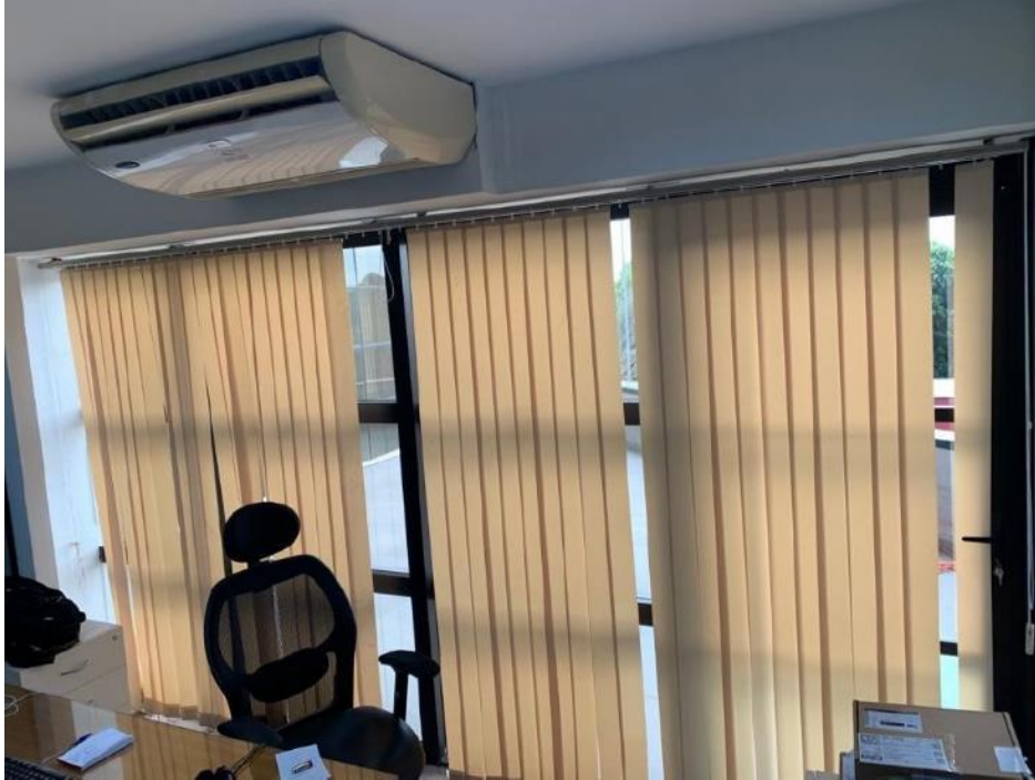
Figura 7: Corpo de auditores