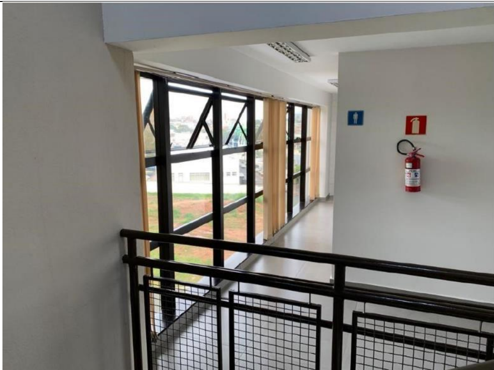
Figura 24: Sanitário masculino