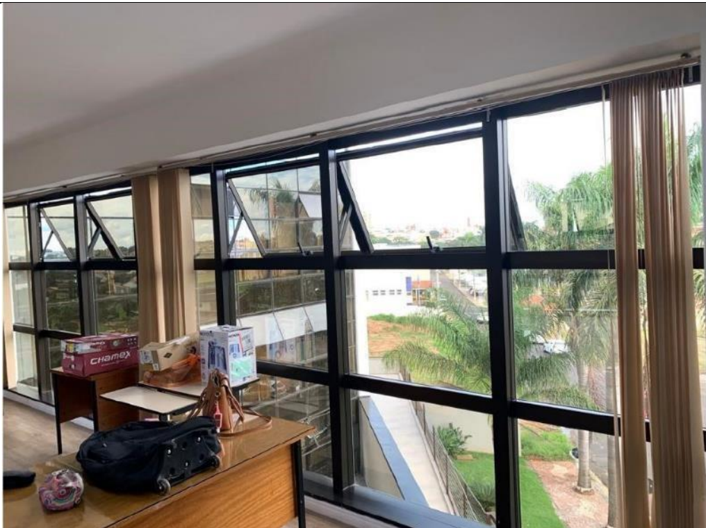
Figura 22: Seção 11.4 – Lado esquerdo