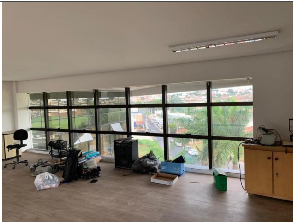
Figura 30: Depósito – Lado esquerdo