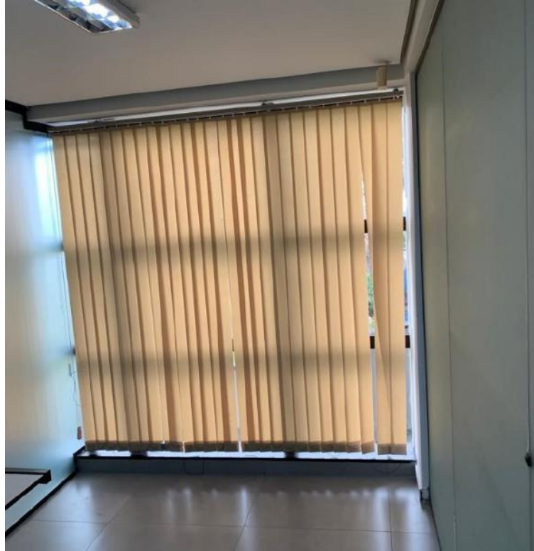
Figura 13: Sustentação oral