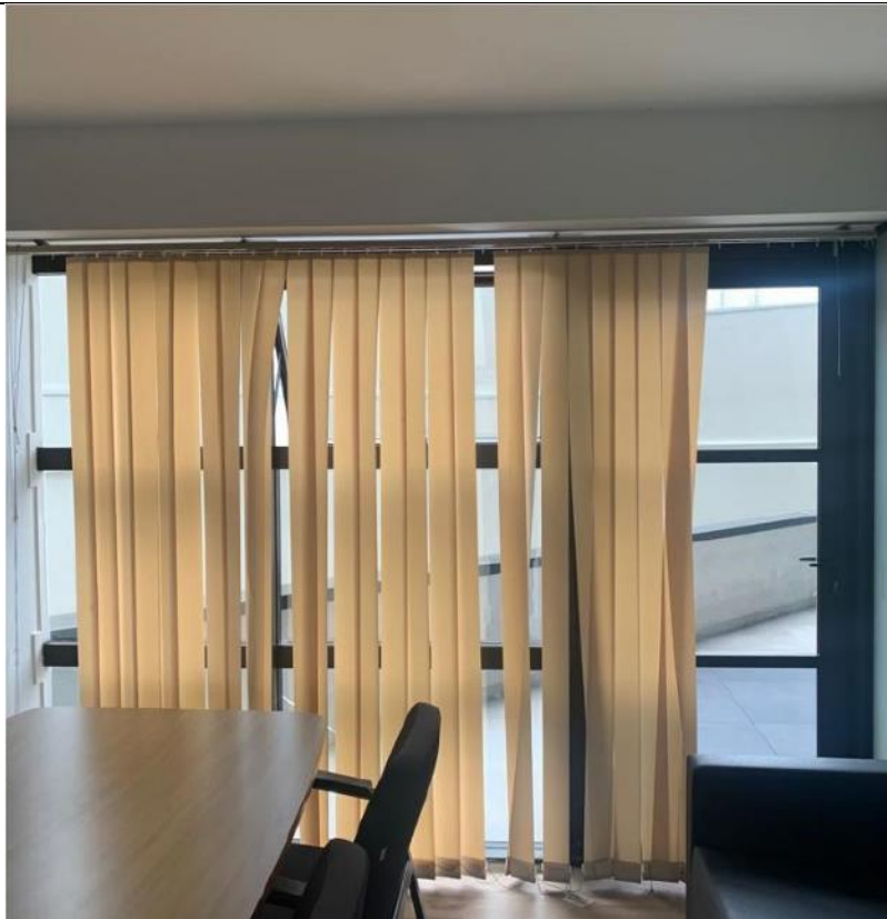
Figura 8: Diretor – Lado direito