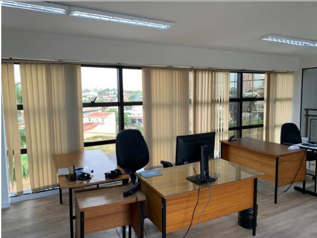
Figura 26: Seção 11.5 – Lado esquerdo