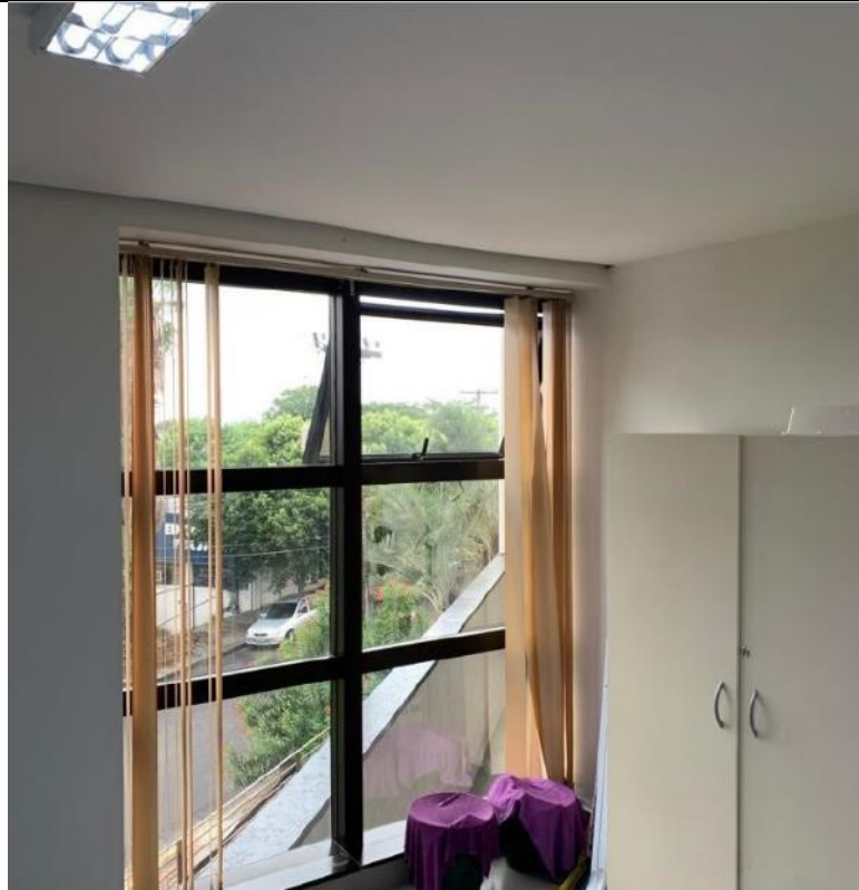
Figura 15: Copa – Lado direito