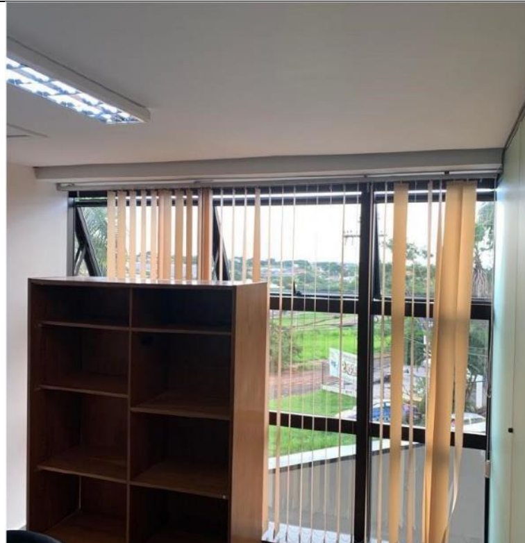
Figura 14: Corpo de auditores 2