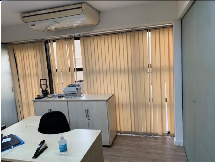
Figura 6: Gabinete