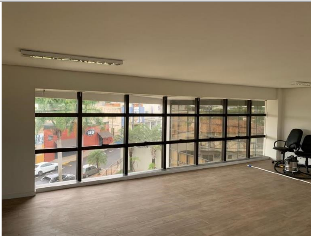
Figura 29: Depósito – Lado direito