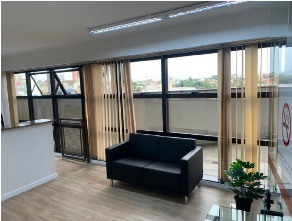
Figura 4: Protocolo – Lado direito