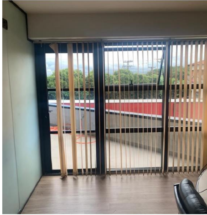
Figura 9: Diretor – Lado esquerdo