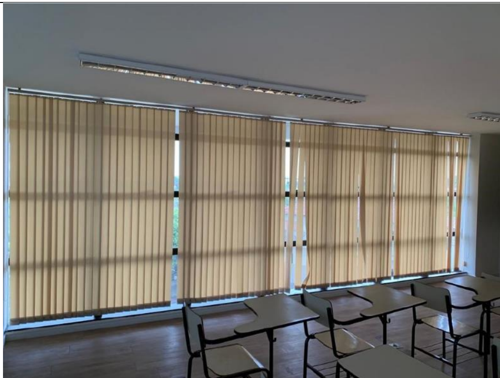
Figura 28: Auditório – Lado esquerdo