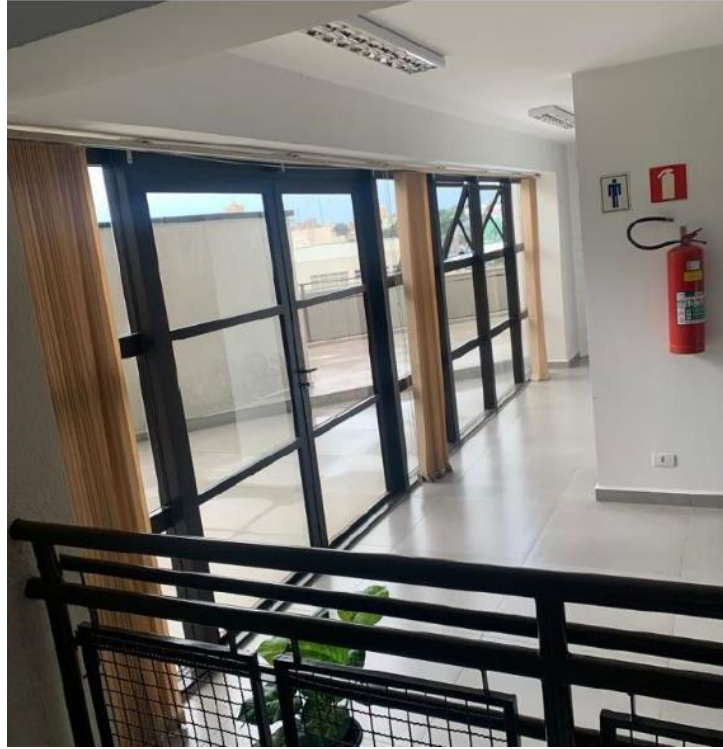
Figura 3: Sanitário masculino