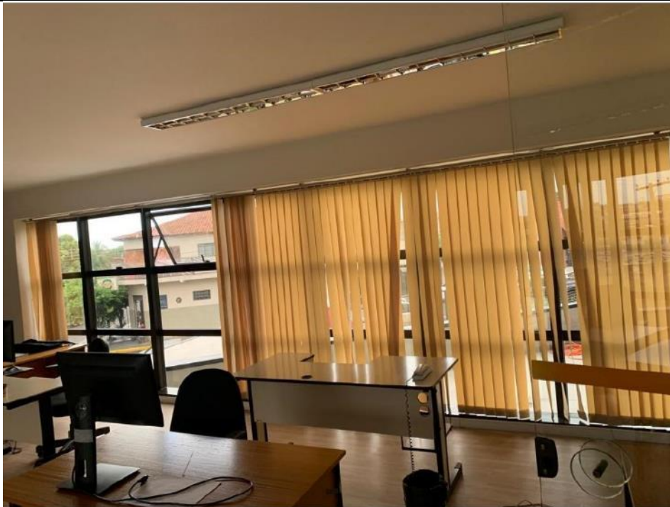
Figura 10: Seção 11.1 – Lado direito