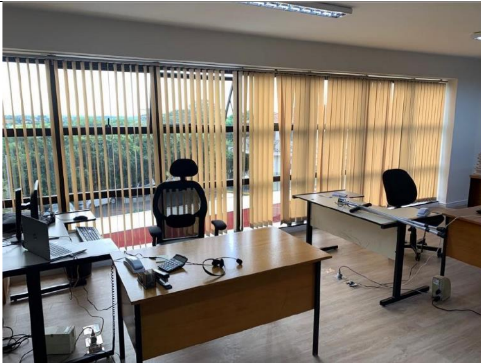
Figura 20: Seção 11.3 – Lado esquerdo