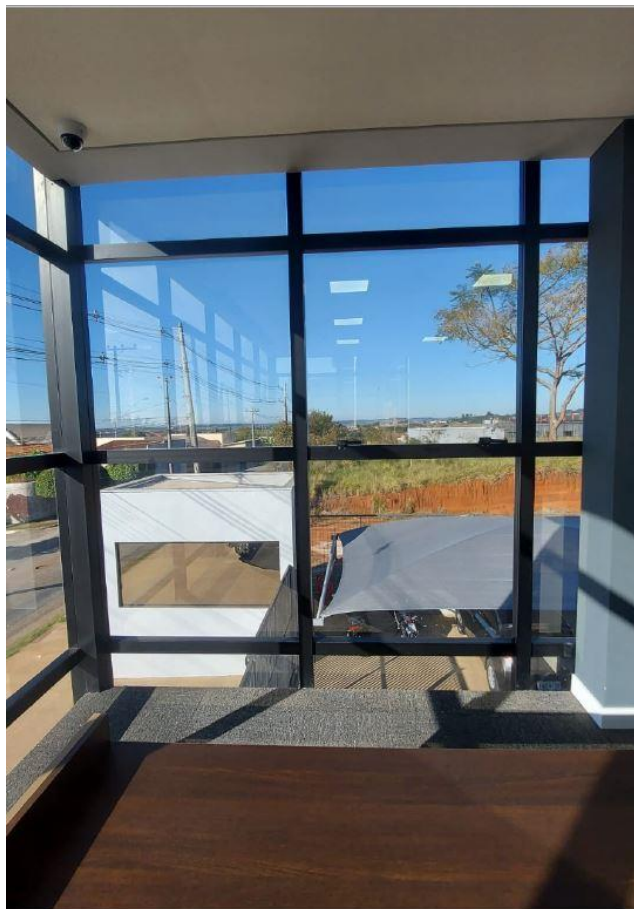
Figura 13: Sala 9 - Janela 3