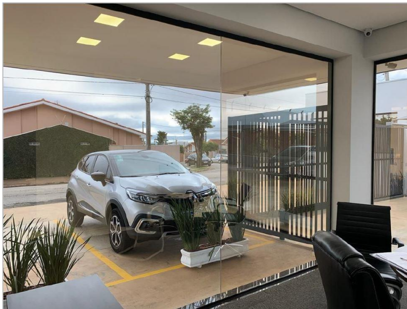
Figura 2: Sala 1 - Janela 1