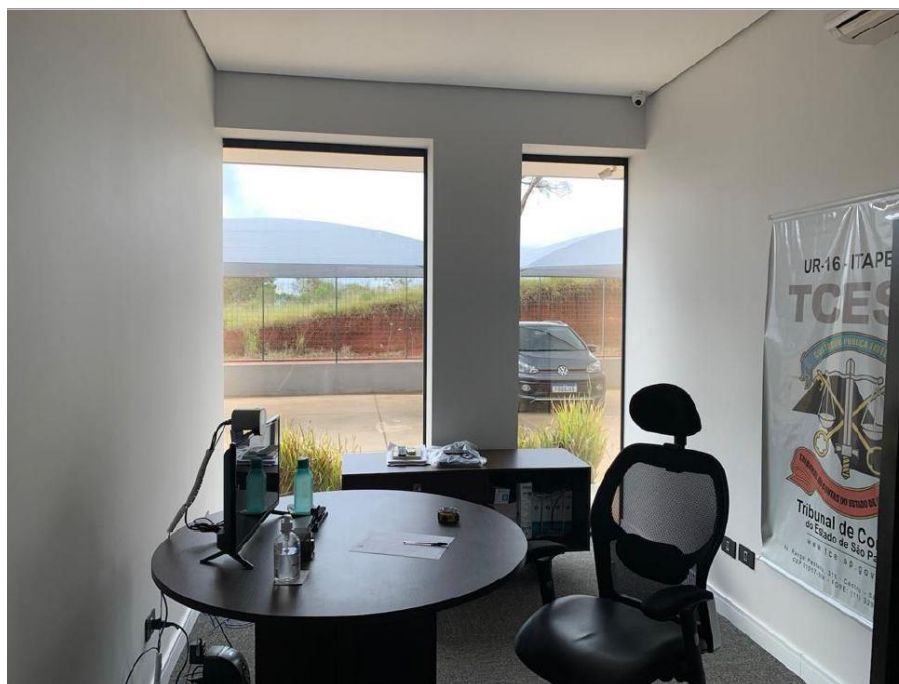
Figura 4: Sala 2