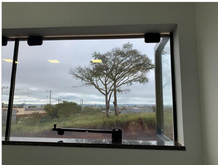
Figura 8: Sala 3 - Detalhe