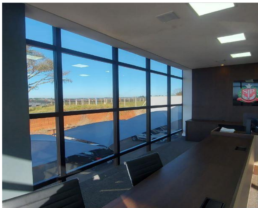
Figura 14: Sala 9 - Janela 4