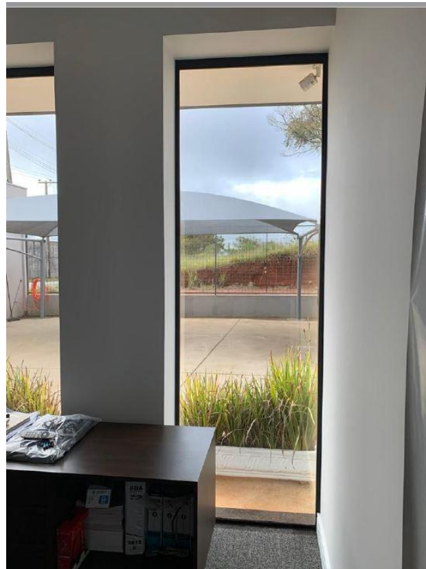
Figura 6: Sala 2 - Janela 2