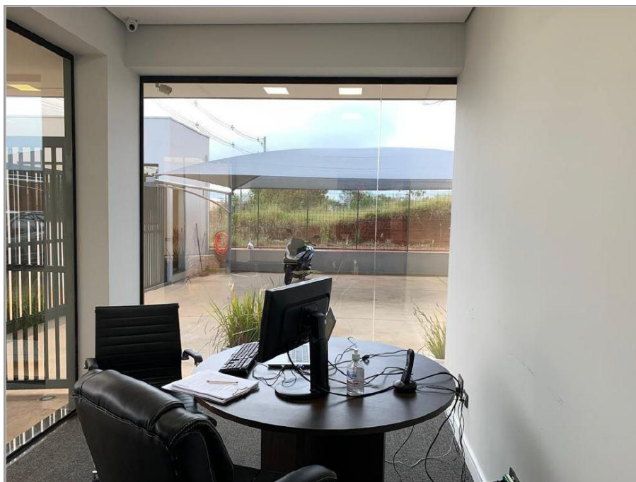
Figura 3: Sala 1 - Janela 2