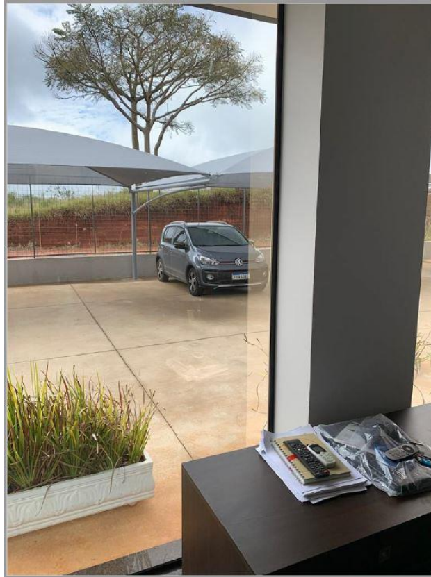
Figura 5: Sala 2 - Janela 1