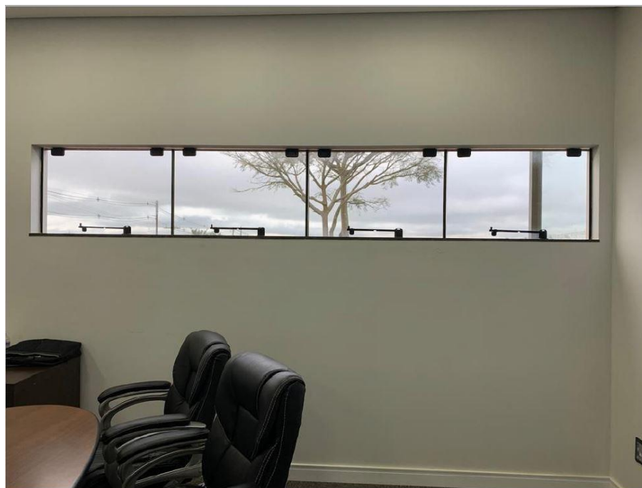
Figura 7: Sala 3 – Janela única