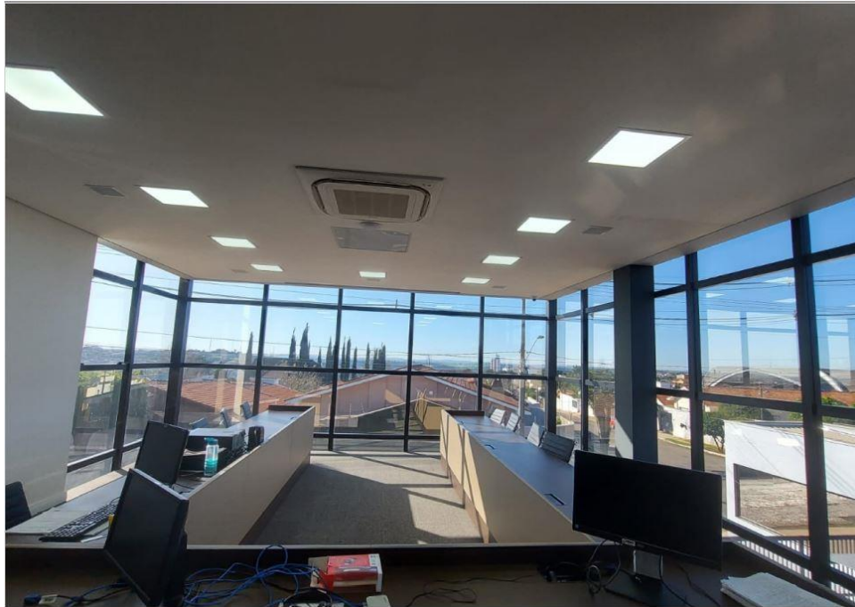
Figura 9: Sala 9 - Vista 1