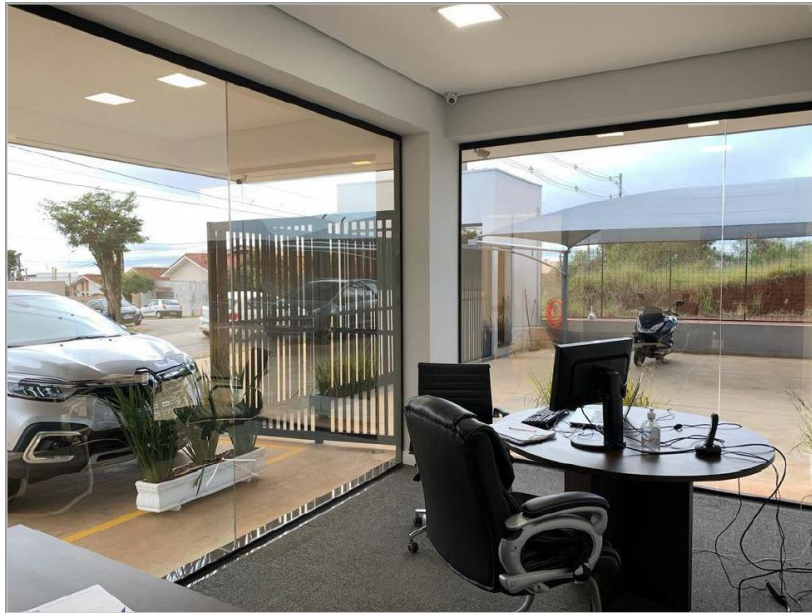
Figura 1: Sala 1