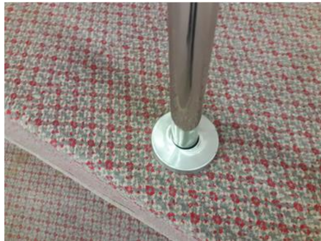
Imagem 12 – Suporte de fixação do corrimão.