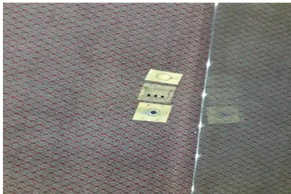
Imagem 9 - Inserção dos espelhos para tomadas.

Na borda do mezanino, como acabamento, considerar a utilização de mata-junta ou equivalente para efeito de arremate (apresentação de amostra do arremate à Comissão de Fiscalização para aprovação) – Imagem 10, abaixo.