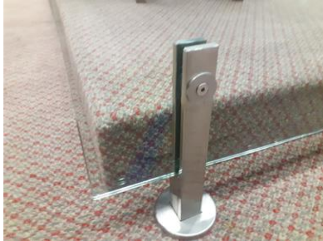
Imagem 11 – Suporte de fixação do guarda-corpo.