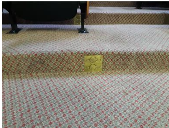
Imagem 8 – Inserção dos espelhos para tomadas.