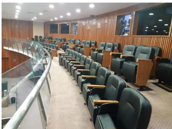
Imagem 4 – Visão geral do mezanino.