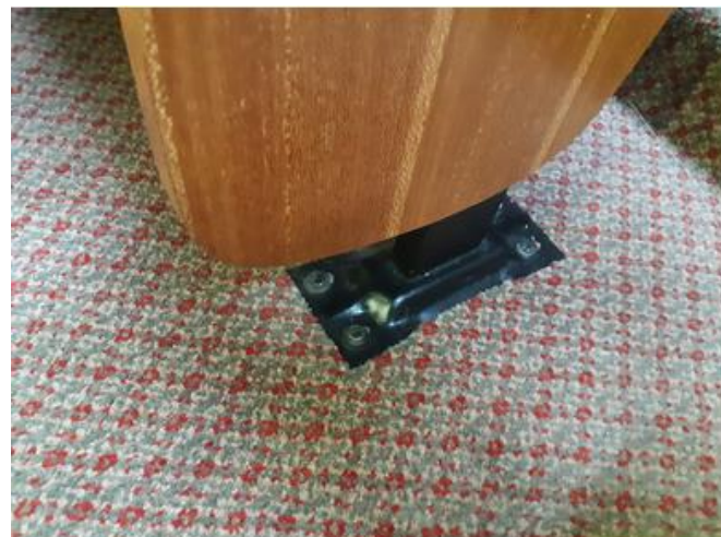
Imagem 13 – Suporte de fixação das poltronas.

Serviço contempla, ainda, a remoção da forração existente, e serviços necessários para deixar a superfície do piso apta ao assentamento da nova forração. O descarte da forração removida correrá por conta da Contratada, observando a legislação pertinente, a título ilustrativo: a Lei Federal nº 12.305/10 (Política Nacional