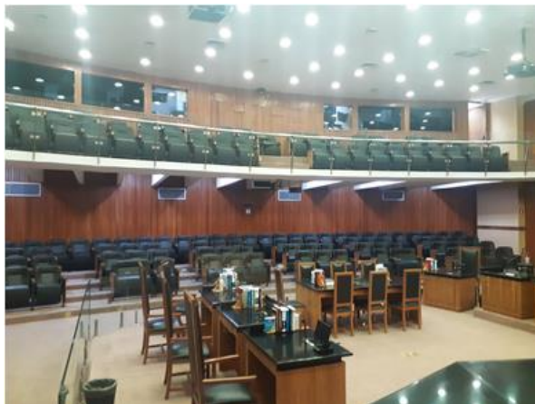
Imagem 2 – Visão geral do Auditório Nobre.