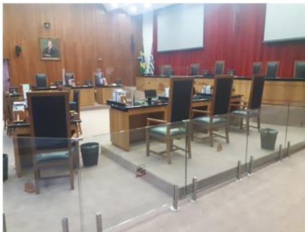
Imagem 1 – Visão geral do Auditório Nobre.

Escopo da contratação contempla o fornecimento e assentamento de carpete para o piso do Auditório Nobre do TCE-SP. Tratando-se de substituição de forração, a contratação em questão contempla a remoção e descarte apropriado do atual carpete, remoção e posterior reinstalação das poltronas instaladas no auditório, bem como de elementos outros fixos no piso, como corrimão de aço inox e guarda-corpo de vidro.