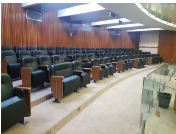
Imagem 3 – Visão geral das poltronas.