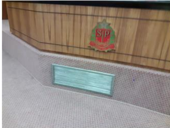
Imagem 6 – Inserção de painel tipo veneziana.