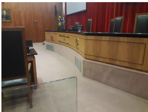
Imagem 5 – Elevação do palco.

Fornecimento em questão, carpete e seus insumos e acessórios, para a forração de 440 m 2 de área . Citada área compreende os pisos do auditório (Imagens 1 e 3) e do mezanino (Imagem 4), além de seis “tablados” ou palanques de 1,2 x 2,0 x 0,17 m (largura x largura x altura). Dos pisos do auditório e do mezanino, a forração em questão deve contemplar os “espelhos” (áreas ou painéis verticais) presentes entre as elevações dos “patamares”, especificamente nos locais em que se encontram as poltronas (auditório e mezanino – Imagens 2, 3 e 8), da elevação do palco (Imagem 5), da rampa de acesso ao palco principal e dos degraus presentes nesses “desníveis” ou patamares (auditório e mezanino).