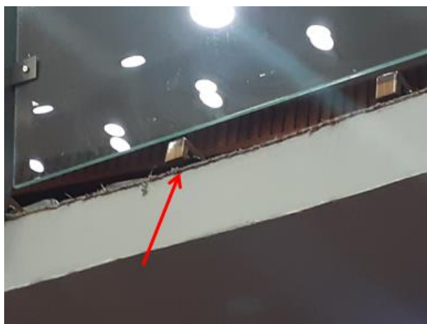
Imagem 10 – Local a ser considerado acabamento ou arremate com mata-junta.

Na borda do mezanino, como acabamento, considerar a utilização de mata-junta ou equivalente para efeito de arremate (apresentação de amostra do arremate à Comissão de Fiscalização para aprovação) – Imagem 10, abaixo.